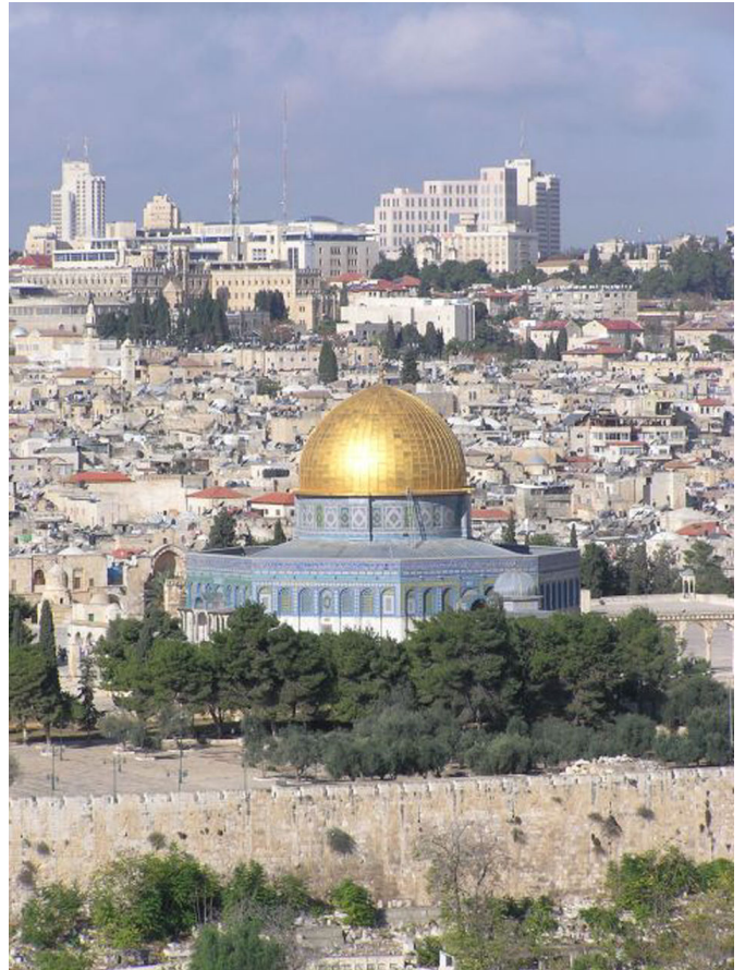
Jerusalem mit Felsendom