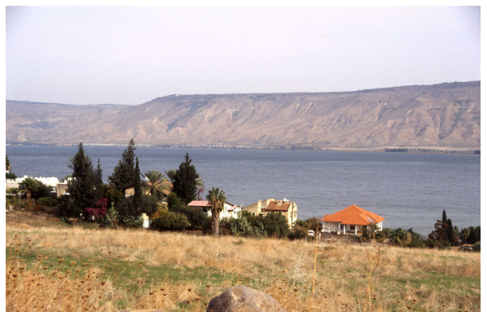
See Genezareth mit Blick auf den Golan