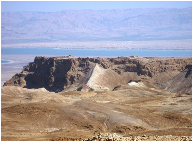
Blick auf Massada und das Tote Meer