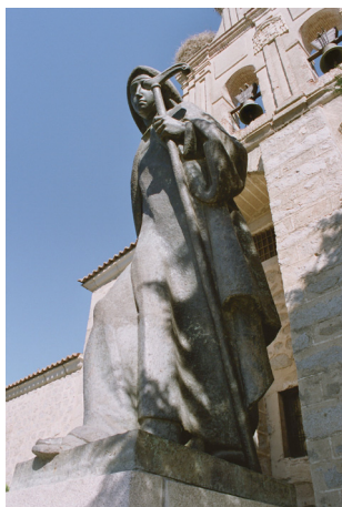
Teresa von Avila (Avila)